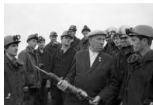
...а потом я закидываю её ляшки себе на плечи...