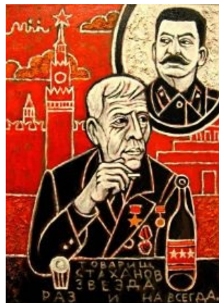
Зачинатель стахановского движения