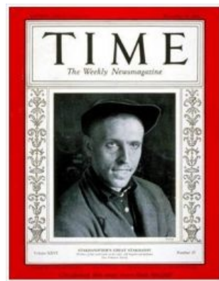
OGPU, Siberia, Stakhanovism — выбери нужное

Когда разговоры дошли до Брежнева , дорогой Леонид Ильич удивился не тому, что знаменитый шахтёр