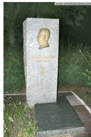
Ранний вариант памятника