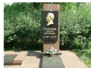
Нынешний памятник на могиле Стаханова

«— Сволочи! — пустил слюни и сопли расквасившийся вконец избранник судьбы, — Какие-то молокососы получили уже по две звезды, а меня, Стаханова, только сейчас вспомнили! Пусть они свою звезду мне на могилу повесят!