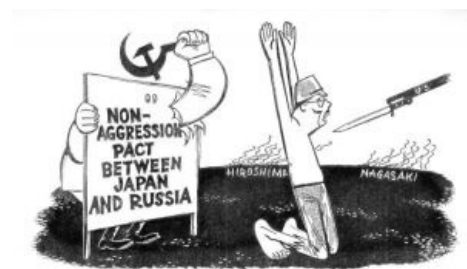
Удар в дупу бедным джаппам

Всего лишь за полмесяца Красная Армия и примкнувшие к ней монголы разыграли неоклассический блицкриг на территории, равной двум Западным Европам. Всё, чему научилась РККА на полях сражений Великой Отечественной , было с успехом применено против япошек. Тут вам и римейк операции «Гельб» с прорывом через горы, и совершенно наглый визит генерала Плиева в