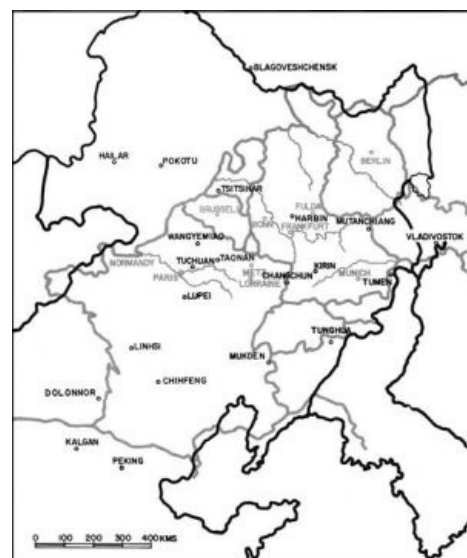
Коллаж полковника Гланца как бы намекает нам