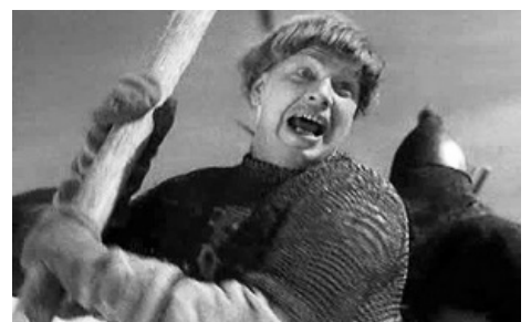
Русский цвайхендер vs тевтонский