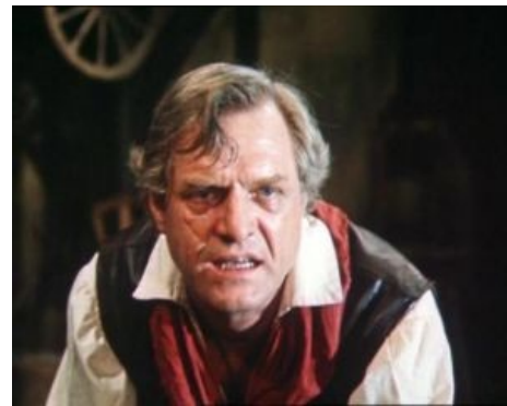
Джим, блджад, дай мне рому!

«Побег» в «Знатоках» и едва не замочивший Томина, несчастный Урбенин, спившийся и встретивший своего полярного лиса на каторге из-за суки-жены («Мой ласковый и нежный зверь»), суровый начальник северной стройки Глухов, задавивший как таракана бандюгу в «Схватке в пурге», мастер лесорубов Гасилов, толсто тролливший неуёмного комсорга («И это всё о нём»). Алсо, Билли Бонс в урезанном «Острове сокровищ», причём совковая цензура среди прочего удалила именно весёлые сцены с Билли Бонсом.