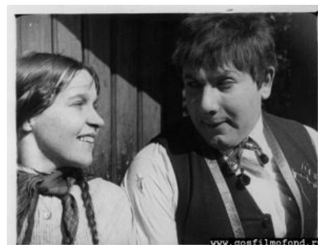
Игорь Ильинский в фильме «Закройщик из Торжка», 1925 год