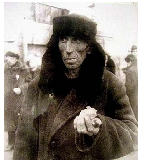
Это не Филиппов. Наверное...