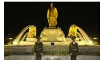
Золотая статуя № 1