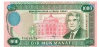
Туркменбаши на купюрах...