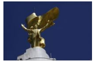
Золотая статуя № 2 (та, что вращается вращалась до демонтажа в 2010 году)