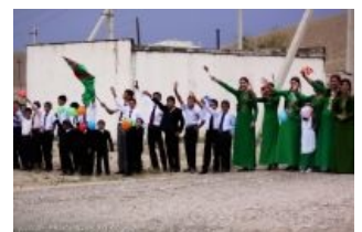
Расовые туркменские дети зигуют во славу Туркменбаши