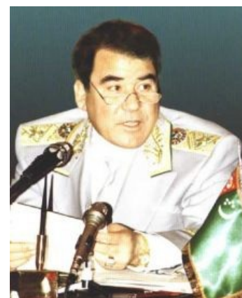
Туркменбаши в нижаме генеральской форме

СНГ- КЛУБ ДИКТАТОРОВ. ТУРКМЕНБАШИ. Туркмения Обзор