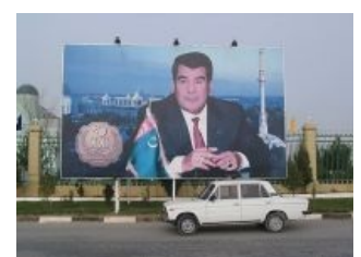
Нияз и ТАЭ