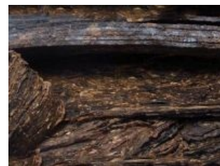
Прессованный трубочный табак («флейк»).