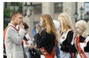
Одухотворённые лица детектед

Педагоги в одиночку, да с помощью нотаций мало что изменят. Дети -зеркало общества. А какое оно у нас? Поэтому полностью согласна с тем, что самим необходимо вести здоровый образ жизни, пропандировать его и бесконечно убеждать. Во-первых только личный пример имеет самое сильное воздействие, а во-вторых, человек вправе выбирать. Если сегодня многие ученики выбрали курение как атрибут взрослой жизни, а повзрослев, хоть один из них выбрал здоровый образ жизни, значит наш пример и убеждения помогли.