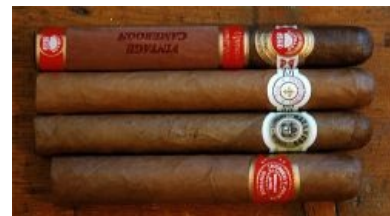
Понты друзья, просто понты

Самое понтовитое, глупое и дорогое из табачных удовольствий. Цена одной (!) нормальной сигары колеблется от 400 рублей до over 9000. Откуда же такая невъебенно высокая цена? Всё просто: дорогой табак в сердцевине, связующем листе, цельном покровном листе табака и НЕОЖИДАННО отсутствие опилок. Плюс-ручная скрутка, бренд сигары и т. д. и т. п.. Короче, просто понты . Хотя, есть и более, я бы сказал даже неприлично дешёвые образцы российского производства. Но лучше их не пробовать. Анон был свидетелем, когда курильщик, предпочитавший сигары «Romeo y Julieta», попробовал российские «Cherokee». Стоит ли что-то объяснять? Учитывая, что сигару взятяг курить невозможно, (потому что при самой малой затяжке дым пойдёт у вас даже из жопы), то дым смакуется во рту, от 20 до 90 секунд — зависит от стажа курильщика, выдержки и крепости сигары.