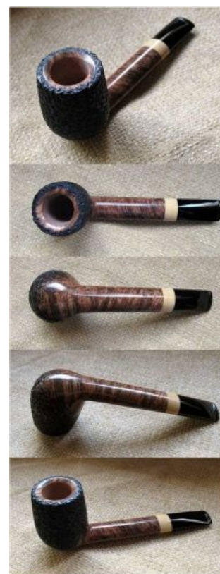
Жизнь, прекрасна, как