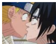
Вот и обоснуйчик готов, сами виноваты