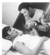
Самая первая слэш-пара