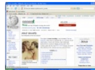
Засветился в википедии