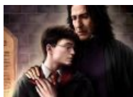
Поттер опять получил отработку у Снейпа