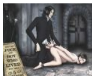
И их отработывает