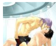
Грань между слэшем и яоем очень тонка