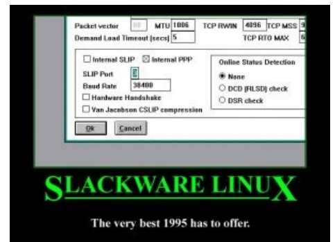
Шлака такая Шлака