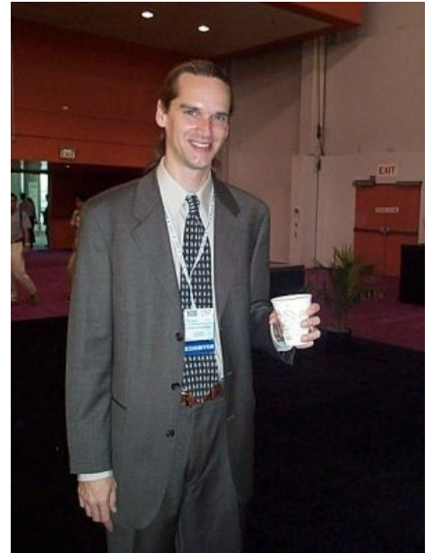
Ты — такой же

Таким образом, дистрибутив живёт отдельно от своих юзеров.