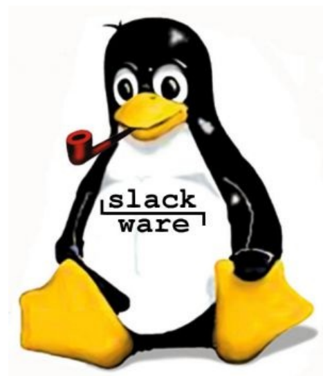
Маскот Слаки — Тукс с трубкой