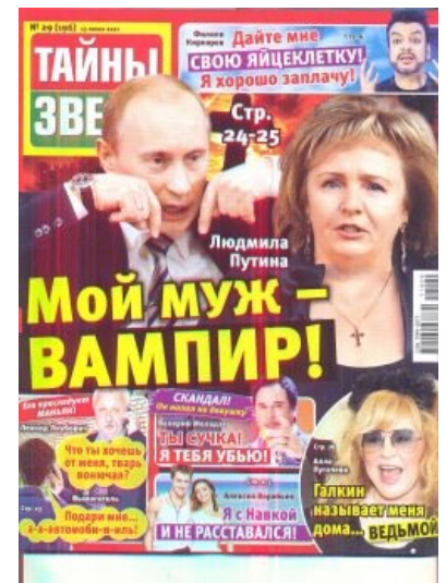
Сферическая жёлтая пресса России в вакууме