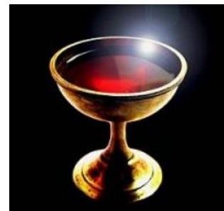
Просто чаша с крвьью Христовой мурсиками

Алхимики и вообще мистики трактуют вышеперечисленные книги в том порядке и ключе, который им вздумается. Вплоть до того, что Грааль — это ЖПП , или чашка, куда надо собрать менструальную кровь и утопить там камень , а потом выпить это всё в полнолуние, сидя на муравейнике голым задом... Так алхимики сделали Грааль из религиозного символа — фаллическим да мистическим. И заодно символом бессмертия , что в исходных легендах ни разу не присутствовало. Встречаются и диссидентские версии легенды. Например, у Вольфрама фон Эшенбаха Грааль — камень, а Галахада нет и в помине (его роль играет Персиваль) [1] .