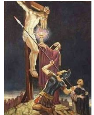
Так всё и было

Впрочем, роман Кретьена не окончен: неизвестно, чем является Грааль. Нет прямых упоминаний Христа или Иосифа. Зато эту удачную заготовку разработал Роберт де Борон в своём «Joseph d'Arimathie», где чёрным по белому подробно прописана история сбора крови в сосуд, исход Иосифа в Британию, передача Грааля от потомка к потомку вплоть до последнего, который и становится Королём-Рыбаком — тем самым, что ждёт прихода истинного наследника.