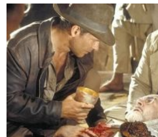
Индиана Джонс и сабж