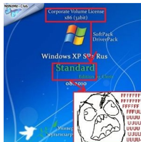
Капитан в панике