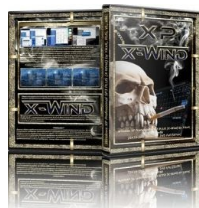
Пафосный вид скрывает ужасную начинку

Автор, некто Бедрин , отличился, кроме всего прочего, запихиванием