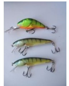
Сферические воблеры в вакууме