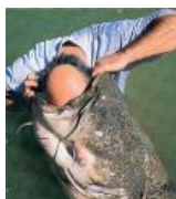
Ловля на живца