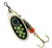
Блесна, такая блесна