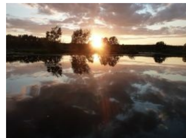
Некоторые локации неиллюзорно доставляют не хуже самой рыбалки