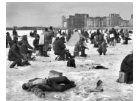
Ниасилил. Nuff said