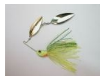
Спиннербейт — чудо рыболовно-инженерной мысли