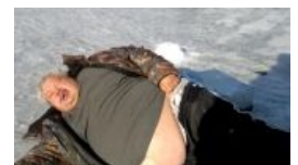
Типичный любитель подлёдного лова

«Если бы я не знал, что это удовольствие, я подумал бы, что это пытка. »