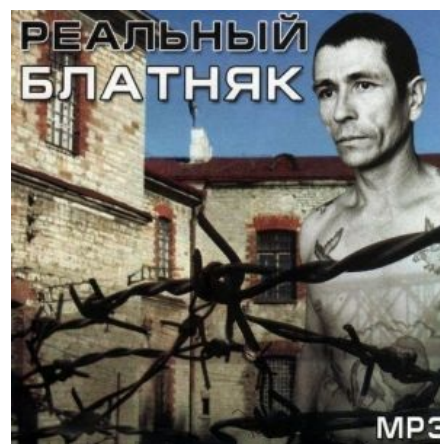
Во всех маршрутках страны