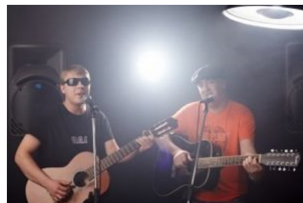
Чёткие ПОЦаны в процессе создания очередного высера

Основная статья: Русский шансон/Известные исполнители