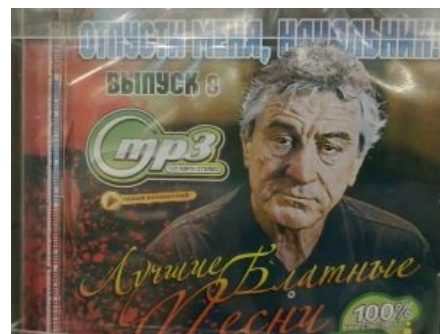
Роберт ДеНиро: Отпусти меня, начальник

Унылая судьба Круга вовсе не редкость в этом жанре. Шансонье погибают частенько как насильственной смертью (в том числе в автокатастрофах, как правило — с перепоею), так и естественным путём — от болезней: лекторского бронхита и астмы. Последнее вполне естественно для людей,