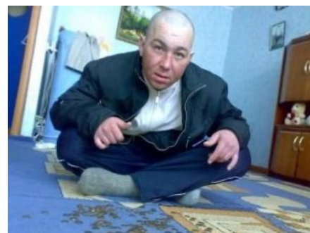
Целевая аудитория элитарного шансона