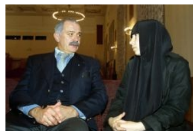
Михалков такой Михалков...