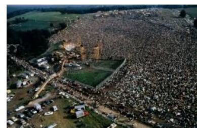
Они заполнили Вудсток

Через год в старушке Англии на острове Уайт прошёл третий по счёту фест Isle of Wight Festival , на который набежало около 600 тыс. людей. Британский парламент срал кирпичами.