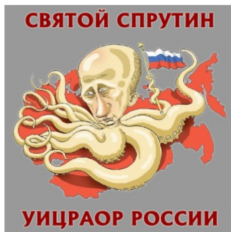
Кто бы мог подумать?