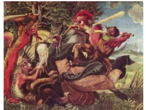
Краткое содержание книги

В основе учения Розы мира три основные идеи, две из которых — постулат. Первая идея о двойственности мира, пронизанного влиянием мира горнего и мира демонического, на стыке которых мы живем. Вторая идея о том, что над нами находятся миры и миры, и мы лишь один из миллиона и миллиона миров, и Иисус Христос — всего лишь наш, планетарный Бог. И третья и самая главная идея — идея Розы — каждый из лепестков которой является одной из религий правой руки: христианство , буддизм , иудаизм , индуизм, ислам . А вместе это новая религия человечества, которая возьмет в себя все лучшее из всех религий посредством тщательного отбора и воцарится на Земле до прихода Аццкого сотоны, который будет реинкарнацией угадайте кого .