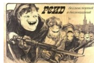
Anonymous wants you