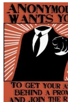
Anonymous wants you