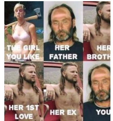
Шутка про инцест среди реднеков

Дополнительной фишкой каджунов является заметное отличие в отношении к неграм. Так, если реднеку негр — не только объект охоты, но и конкурент на рынке труда, то каджуны к неграм относились весьма толерантно (у них и язык-то часто один был), добавляя здоровую дозу сюра в облюбованную ими Луизиану на фоне всех остальных США. Перекрёстное опыление путём половой ебли каджунов с неграми и креолами привело к смешению культур, местами до неразличимости, а также добавило здоровую долю вуду в культуру каджунов; однако, эта же особенность сделала локальных белых ещё более странными существами в глазах доминирующих