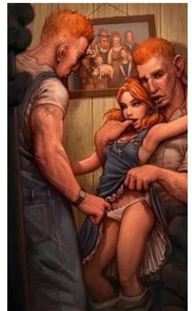
Вот как-то так