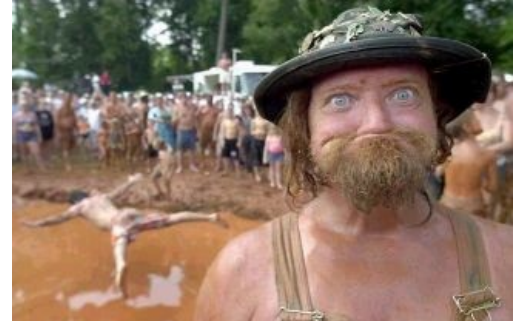
Хиллбилли на фоне выгребной ямы общественного бассейна

Реднек (англ. redneck , буквально «красношей») — нерусское название колхозника , отечественному читателю знаком больше по фильмам («Изи Райдер», например) и игре Redneck Rampage («Ярость деревенщины»). Шея становится красной (у нас это называется загар тракториста ) вследствие повышенных дозовых нагрузок солнечной радиации на скрюченное под тяжестью мотыги тельце землероба и в особенности на его открытую шею, что не может не вызывать расово детерминированные последствия облучения в коре и древесине его переднего головного моска .