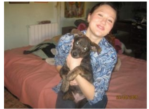
ТП и её сраный пёсик

Зооматери — опекуны, собираются компашкой из себе подобных и отправляются в городской парк, чтобы на детской площадке разбросать мешок с пищевыми отходами для стаи псин или похожих на них существ. Там же строят им же будки из коробок и фанеры.