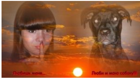
ТП и её сраный madskillz

Зооматери — то, во что рано или поздно превращаются зоозмо. Самоназвание — «опекуны бездомных животных», этот термин юридически закреплён в законодательстве некоторых городов Украины и России (например, в Перми и Киеве). Пытались его ввести в Москве в 1990-е, но безуспешно.