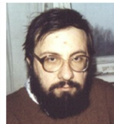
Пруль усат и бородат

Пруль — исторический персонаж хряковского Фидо . Стоял у истоков создания харьковского Фидо и интернетов, внёс существенный вклад: пользуясь ресурсами интернет-провайдера, в котором работал, получал российские эхи и раздавал их харьковским фидошникам. За это благодарные фидошники ещё в начале 90-х годов прошлого века назвали еженедельное собрание фидошников не сисопкой, как в других городах, а прулёвкой , которое сисопка и носила в течение всего времени своего существования.