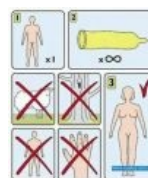
Инструкция по применению