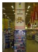
Специальное предложение для школьников.