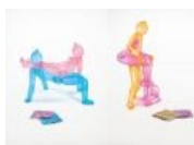
Презерватив в Большом Искусстве