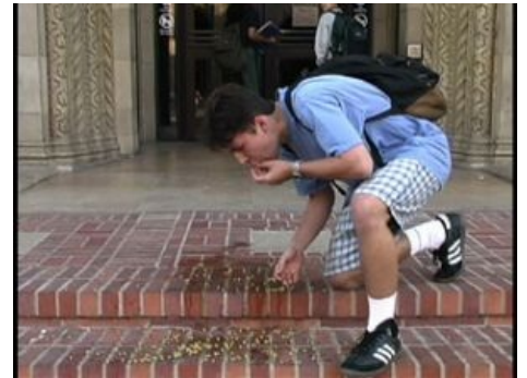
Применяем правило на практике