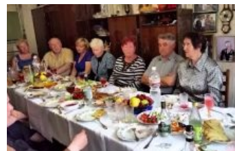
Поминай, ёпт! С вилками, ага

Полгода — не отмечаемая, но бешено ожидаемая частью родственников дата, так как через шесть месяцев наследник может вступить в свои права и невозбранно продать квартиру и « форд фокус », получить денежные сбережения. Также в России традиционно считается, что именно через полгода