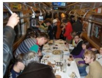
Хоронили зацепщика , порвали три вагона