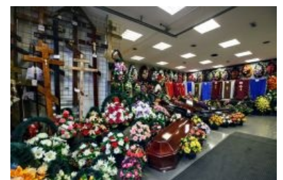
В ожидании клиентов

В этом этапе ты уже не участвуешь, чего не скажешь о твоих родственниках, на которых, как правило, ложится вся тяжесть хлопот по погребению. Чтобы официально вычеркнуть тебя из списка живых, требуется оформить соответствующие документы. После вскрытия выдаётся справка о смерти, где расписано, как, где и по какой причине податель-еего усопший окончил жизнь. На основании этой справки ЗАГС выдаёт родственникам свидетельство о смерти — документ, подтверждающий, что ты, дорогой читатель, bist tot . Ну, или каза болду — особой разницы нет. Без свидетельства о смерти невозможно оформление похорон. Всё, теперь тебя нет не только физически, но и официально. Эти