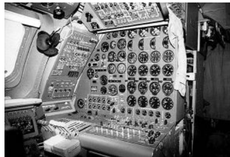
Туполевская эргономика: типичное рабочее место бортмеханика из Тушки той эры