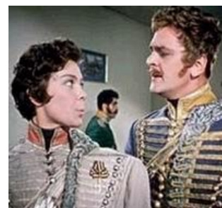
Поручик Ржевский в фильме Рязанова (справа)