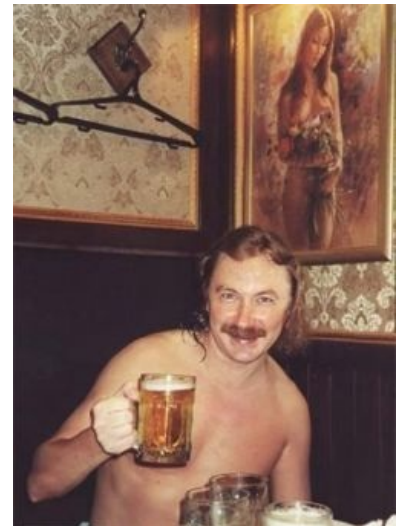
Николаев пьёт за любовь

https://www.youtube.com/watch?v=4vnEsHg_0o8