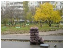
Для самых ленивых. На заднем плане входы в погреба