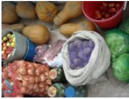
Балкон запасливого хохла. Картошки всего полмешка — остальная в погребе