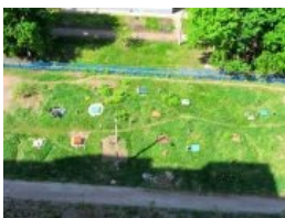
Типичный вид из окна многоэтажки в спальном районе Харькова