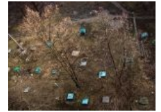
Может, в Харькове нет центральной канализации, и аборигены роют себе персональные сливные ямы?