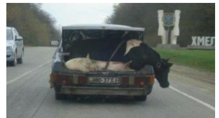
Годная перевозка на Украине

Полкабанчики привозят полкабанов на дизельном пассатике (канонічн. бел. Пассат-бэ-тры-белы-дызель ), заправленном ворованной соляркой. Предпочтительная форма кузова — универсал, потому что в него помещается больше полкабанов. Пассатик надежен и экономичен, потому что работает на дизеле или на газу. Ремонтируется только тогда, когда становится колом посреди дороги, и только оригинальными китайскими запчастями из тех, что «танней» «падзяшэўле». В морозы не заводится. Резина, как правило — лысая летняя или шиповка круглый год.