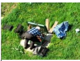
Типичный вид из окна многоэтажки в спальном районе Харькова

способствуют тому, что желание получить передачку с деревни растёт и в наши дни. Ведь там всё натуральное и экология лучше. Поэтому при поедании нямка получает дополнительно +9К к вкусоности и полезности. Но по крайне мере можно быть спокойным за отсутствие пестицидов и химикатов в овощах, переданных родственниками, и что живность была зверски зарезана, а не умерла своей смертью .