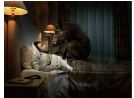
Полкабана душит белоруса

Алсо, по космогоническим представлениям белорусов целый кабан суть иллюзия, так как состоит из двух половин.