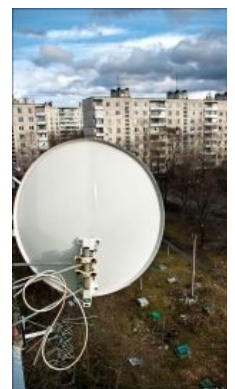
Говорят, иностранцы во время Евро-2012 пугались