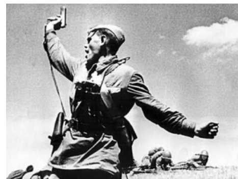
Политрук ИРЛ , за секунду минуту до смерти. (Солдат на заднем

Политрук — мифологический антагонист бандеровца , впрочем, по повадкам почти не отличающийся от последнего. Основной вид деятельности — расстрелы и отбирание еды. В свободное время занят поиском шпионов и пропагандой коммунизма . Это является его характерным отличием от бандеровцев, которые обычно занимаются в свободное время пьянством и пытками (для политрука — это часть его работы, но не развлечение).