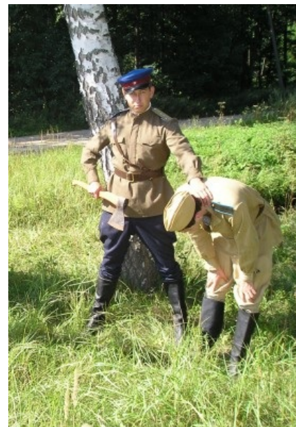
Типичная форма казни, применяемая политруками особистами.

Изначально комиссар появился в 18 веке у макаронников в наемных войсках и контролировал их лояльность. Потом и свежеиспеченные США подтянулись, во время войны за независимость, тоже введя