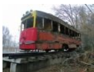
А так он выглядит сзади