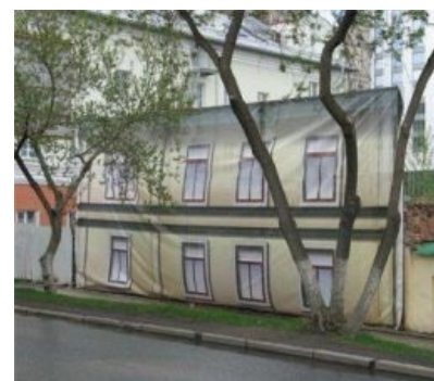
Типичный способ скрыть разруху

« Што делать?! Што делать?! Што делать?! ». Распиленный бюджет перепиливается ещё раз и мэр скрепя сердце направляет на быстрый, решительный марафет деньги, которые хотел оприходовать сам. Марафет действительно выходит стремительный, как и срок его службы.