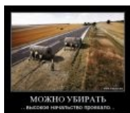
Ну вы понели