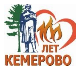
Тот самый логотип