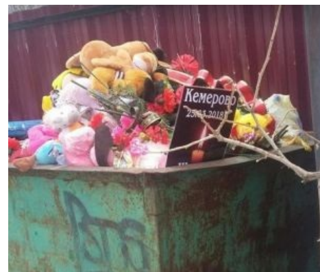
Когда траур закончился

Эта хрень не обошла стороной и рестораны в некоторых ТЦ, где по телеку вместо клипов ставили грустную церковную музыку на фоне свечей. Особо сочной была реакция школьниц, которые выкладывали фоточки в Инстаграм с масками собак, грустными эмодзи и чернобелым фильтром. Также были попытки акций типа «ровно в хх:хх часов на дороге остановиться и зажать гудок и стоять так 5 минут» и т. д. Ну, и как итог, после траура появилась фотография, на которой все игрушки, свечи, и цветы находятся в мусорном баке. Суть всех трауров.