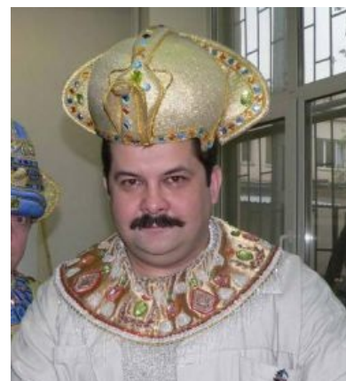
С. В. Пейсатель в фофудье

Помимо квадратно-гнездового писания слов обеими руками, прославлен в основном сварливостью и исключительно мелкой (поэтому — особенно смешной) злопаятностью: регулярно сводит счёты в своих книжках со всеми людьми, с которыми имел какие-то трения, особенно публичные (в Фидо или этих ваших интернетах ). Это, понятное дело, вызывает срачи и доставляет .