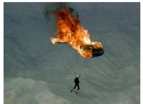
Жизнь парашютиста коротка, но ярка!!!!1