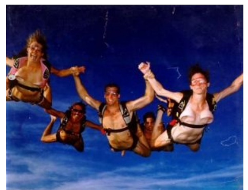
Скайдайверы, такие голые