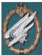
Значок парашютиста в нацистской Германии