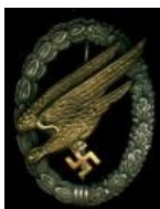
Знак парашютиста Люфтваффе