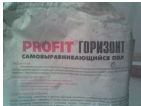
Сухая строительная смесь