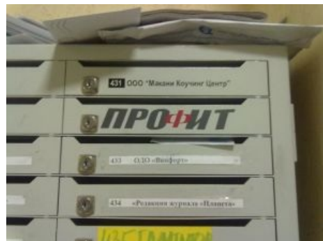
ПРОФИТ такой ПРОФИТ