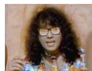
Киркоров н-нада? (1993)