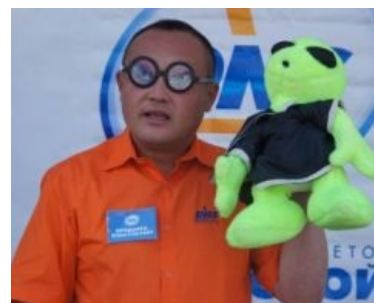
Статья обо мне н-н-нада?

Главный герой — китаец, торгующий на пограничном переходе Дуннин в международных автобусах Владивосток — Суйфэньхэ (Сунька) всякой всячиной — «косоглазыми» очками, игрушками для пуска пузырей, орехами, игрушечными мышами и ослами, а также чётками. Но весь прикол состоит в том, что китаец, надев косоглазые очки, смотрит в камеру и с великим трудом и напором произносит фразы «Атьки ннннада?» и «А щотки нннада?», причём сохраняет ледяное спокойствие , даже несмотря на то, что все пассажиры над ним адски ржут. Судя по всему, он думает, что слово «надо» пишется с пятью буквами «н». Хотя на самом деле китаец придумал и сделал очень грамотный маркетинговый ход — возможно, что таким образом продажи идут лучше.