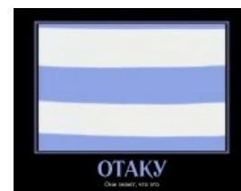
А это уже чуть-чуть посложнее