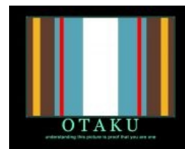
Тест на отаку

русский отаку в естественной среде обитания.