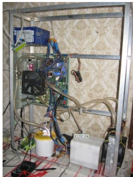
Нищербродский вариант СВО.