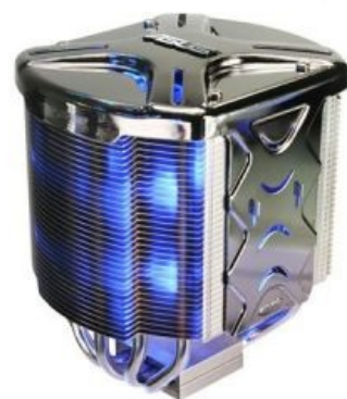
Silent Square EVO

© 2007 ASUS TeK Computer Inc. All rights reserved.