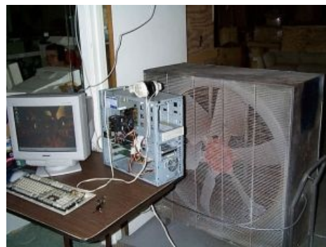
Еще один Цулер.