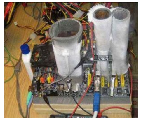
Работает крайне недолго.