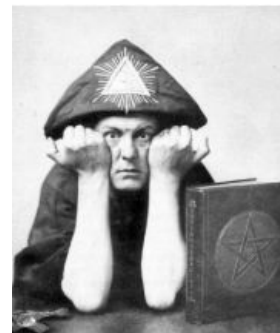
ТруЪ. Это Алистер Кроули , кстати.

В то же самое время поцтреоты всей Европы начали вдохновляться краем уха услышанными офигительными историями из Махабхараты о том, как древние арийцы воевали на слонах и ядерным оружием. Книжки о Славном Арийском Прошлом и Происхождении Казачества Из Ахейцев соперничают по популярности с книжками о кознях масонов и иезуитов. Попутно возникают искатели Утраченной Ведической Традиции — те самые Генон, Эвола и Элиаде, про которых так любит писать Дугин . Правда, традиционалисты писали довольно умно и впридачу не раскрыли темы жидомасонского заговора — поэтому они остаются элитной тусовкой, а нишу «Обучаю Мудрости Предков за 21 День» плотно