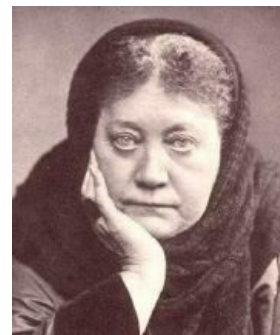
Бабушка русского нью-эйджа смотрит на читателя как на эктоплазму.