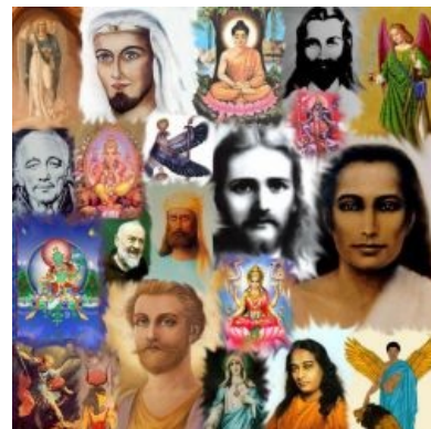
Вознесённые учителя, хуле. Христианские архангелы, египетские и индийские божки наличествуют

Друнвало Мельхиседек — фрик 80-го уровня, проповедует шовинистическую идею о том, что люди, в отличие от инопланетян, наделены некой волшебной-божественной сущностью под названием меркаба, которая позволяет прямо влиять на реальность и вообще быть труЪ магом. Эту меркабу он и предлагает пробудить незадачливому люду. А до тех пор, пока она не пробуждена, предлагает использовать четырёхмерные технологии , основанные на воздействии геометрических форм и мыслей на материю . Помимо прочего говорит о переходе всей вселенной в четвёртое измерение, в результате которого инопланетяне, создавшие людей как своих рабов, умрут, а люди попадут в иной мир, который будет соответствовать их эмоциональному состоянию, если люди будут любить всех вокруг, то переход будет белым и пушистым, а если нет, то кровъкишкираспидорасило. Верит в тайное правительство,