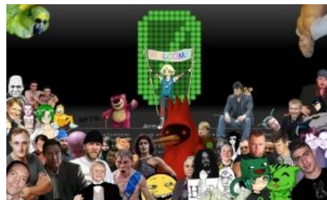
Финальная версия от 26.08.10

Несмотря на среднее качество (композиция проста как яйцо — всё делалось на фоне заглавной Нульча),