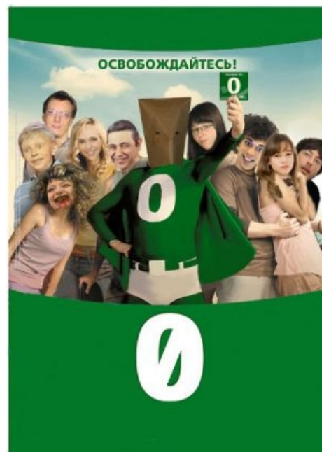
Старая пикча с персонажами