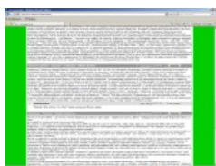
Голодомор и ВНЕЗАПНО нохчи.