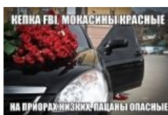
Народное творчество. Кавай .