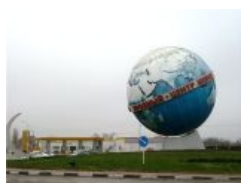
Выше только нёзды звёзды.