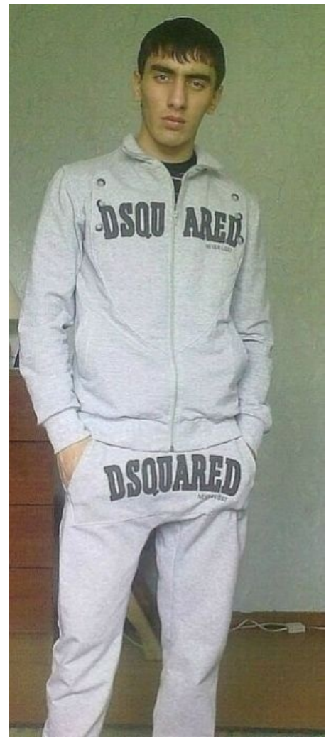
Чотко, дерзко, модно

В последнее время даже научились иногда троллить более-менее тонко. Например: