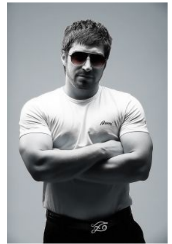
А это VIP-Нохчо, которая смотрит на тебя, как на игрушку рузкого гяура

«NohCHO NohCHO: Ти, молокасос ты хоть понимаеш на кого наэчал? Ты знаеш, кто такой нохчо? Нохчо - это значит сила! Нохчо - чеченец! А ты свинья русский я маму твою в позе делал!