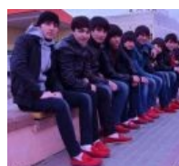
Мокасины, мокасины everywhere!