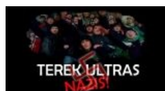
Толсто, очень толсто.