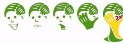
Рука бога в отчаянии на ЧМ-2014

С тех пор для одних этот товарищ — самый мерзкий человек, существовавший на Земле, а «новый Марадона» — страшнейшее оскорбление новоявленных кокаинистов и гандболистов в футбольной форме. (Для англичан он стал ещё и как красная тряпка для быка, поскольку после игры заявил что-то типа «Вы мне, гады, ещё за Фолклендские острова ответите». ) Для других же сей аргентинец представляется долгожданным вторым пришествием господина нашего, а «новый Марадона» — почтительное звание для футболиста с бомбардирскими и диспетчерскими качествами. Первый Марадона же похожий трюк повторил через 4 года на чемпионате мира 1990 в матче со сборной СССР, выбив рукой мяч, который уже практически залетел в ворота сборной Аргентины. Арбитр притворился Слепым Пью, представил бутсу на руке и назначил угловой.