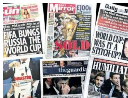
Чисто английская жопаболль