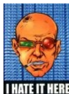
Я ненавижу это здесь.