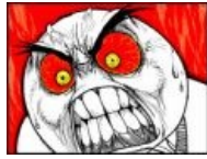
RAGE RAGE RAGE