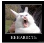
Даже зайцы умеют ненавидеть.