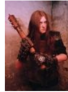
Варг Викернес ненавидит тех, кто ненавидит людей и жыдов .