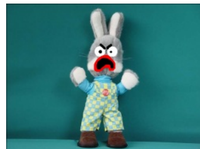
Степашка тоже ненавидит тебя.

Ненависть — просится из берегов, Ненависть — жаждет и хочет напиться Черною кровью врагов!