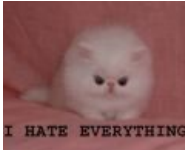
I hate everything