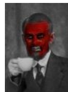
Поливанов впадает в ярость от твоего «дзюдо».