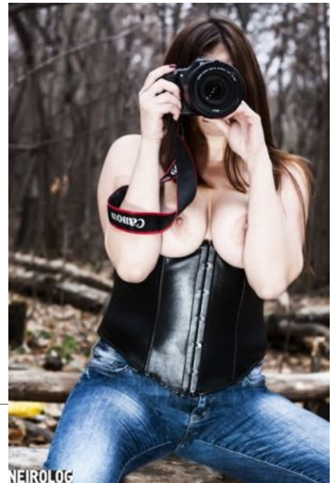
Тема сисек раскрыта