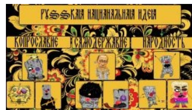
В понимании ватника .

Эта страна издревле отличалась вороватой, изворотливой элитой и клинически тупым стадом. При царе национальной идеей было самодержавие. Царь был от Б-га и следовало плашмя разбиться по первому его повелению. Большевикам удалось первое время насадить свой вариант, в основном за счёт выпиливания IRL всех несогласных с ней. Правда, после того, как буржуев и белых в стране вообще не осталось, пришлось снова делать диктатуру, только уже не пролетариата , а самого шустрого его представителя , которого уже в свою очередь естественным образом удержала у руля Вторая Мировая и возбуждение всеобщей ненависти сначала к немцам, потом к пиндосам. Ну и массовые расстрелы , конечно.