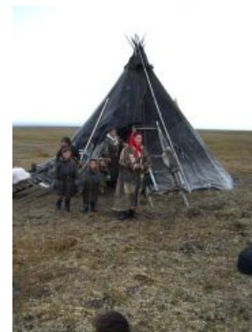
Жилище настоящего индейца этой страны.