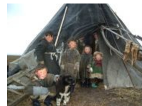
Личинки индейцев этой страны.