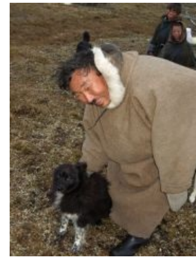
Настоящий индеец этой страны.

Следует понимать, что в американских разборках индейцев использовали очень активно. Знаменитый Эрнандо Кортес , фактически, сколотил союз племён, который прибил ацтеков, которые всех задолбали своими жертвоприношениями; сначала Англия и Франция, а потом США и Англия устраивали пограничные