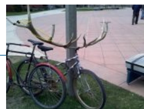
И велосипедисты туда же.