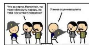
Cyanide ловит суть