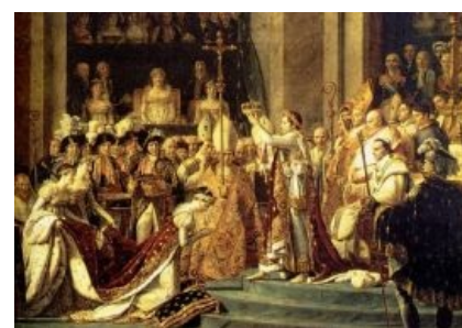
Коронавал император сам себя

(Параллели с происходившем на Украине в 1914-18 и 1941-45 напрашиваются)