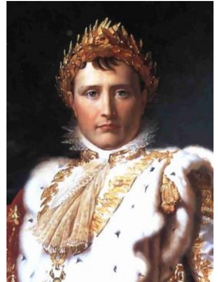
Из грязи в князи

Наполеон Бонапарт (фр. Napoléon Bonaparte , Наполеоне Буонапарте (так его имя произносилось на Корсике)) — один из величайших полководцев в истории этого глобуса, хронологически и количественно первый из человекоубийц 19 века, положивший несметное число народу в Европе и три поколения французов в частности, за что ныне ими всеми глубоко уважаем и отмечен памятниками. А также император республики, торт, коньяк, персонаж одной сказки и поциент палаты № 6.