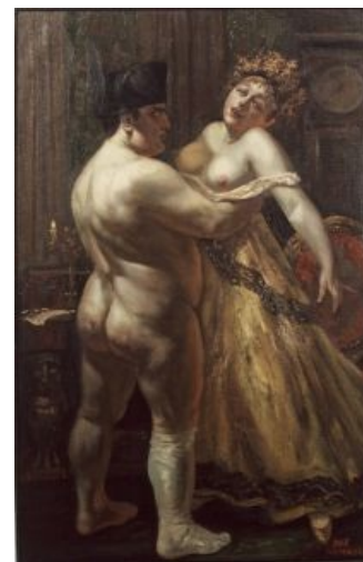
Наполеон овладевает Россией

Позже, когда Александр выражал возмущение тем, что Наполеон похитил и казнил одного из Бурбонов (герцога Энгиенского) на территории формально независимого Баденского герцогства, нарушив этим типа все юридические нормы, Наполеон тонко затроллил Сашу (на самом деле весьма жирно, учитывая