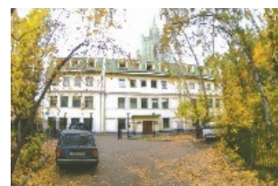
Здание НМУ на Арбате

Независимый Московский Университет (НМУ) — винрарный доставляющий университет в Default City . Настоящий рай для нердов и ад для нормальных людей .