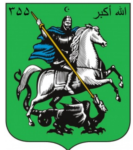
Новый герб Москвабада

Москва - ярмарка тщеславия Сабж — ярмарка тщеславия