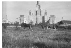
Лоси у МГУ. 1961 год Саурон Василя Блаженного