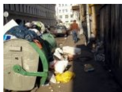
А то ведь можно запачкать исторический центр Москвы... Переулки такие переулки