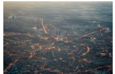
Вид на Москву из кабины бомбардировщика

Мацква — город-паразит, процветающий за счет людей этой страны . Жизнь в Москве и в России — две большие разницы . Поэтому понаехавшие стремятся в Москву за лучшей жизнью, хамоватые нейзаны провинциалы её хают, а потомственные москвичи жутко гордятся своим статусом и нагло плюют на понаехавших, не забывая, однако, сдавать им квартиру за штучку-другую баксов, ибо иначе зарабатывать не в состоянии или банально запаadlo. Вспомним даже официальное обращение на московских празднествах или в метро : «Уважаемые москвичи и гости столицы!..» Житель