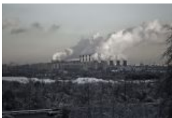
Капотня, самый загрязнённый район Нерезиновой. Также известен как «Малый Норильск»