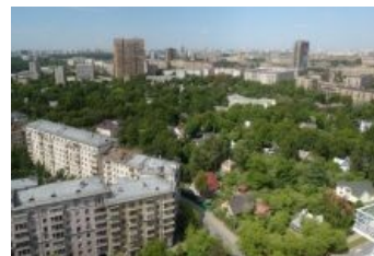
Посёлок Художников. Самое высокое здание справа — НИИ «Гидропроект» на развилке Волоколамского и Ленинградского шоссе