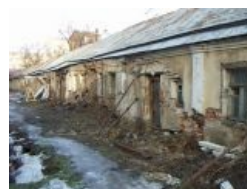
Это тоже Москва, совсем недалеко от Арбата