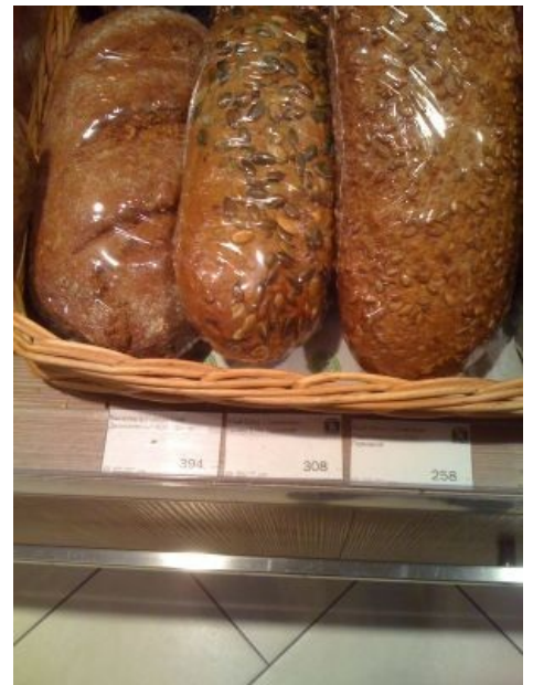
300 рублей багетик