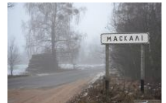
частичный ареал проживания