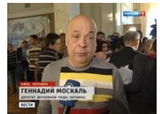
А це Москаль

Геннадий Москаль — украинский расовый политик, бравый милицейский генерал с кучей компромата и годного сарказма против любого оппонента наготове. Несмотря на фамилию, скачет довольно ретиво. Филигранно владеет материною мовою , и, в отличие от других политических ональных клованов , бугуртит досадствует на ней совершенно искренне, чем доставляет. Был поочередно губернатором половины областей и руководителем трети органов исполнительной власти Украины. Глава контролируемой Хунтой™ части Луганской области времён активной фазы АТО, после микровойнушки в Закарпатье переведён губернаторствовать туда. Прославился как понимающий, заботливый руководитель, решающий проблемы одних подданных анальным террором других.