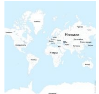
География и расовое распределение