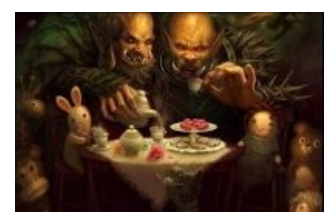
Представитель Вселенского Зла как функция бабая для