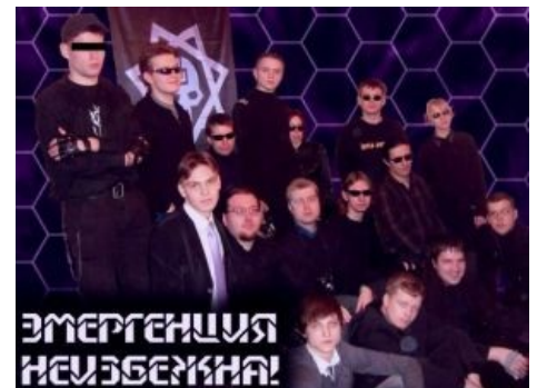
Секта в сборе.