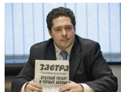
Цесаревич Гога Нервый с каноничной газетой «Завтра»